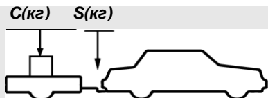
верное размещение груза